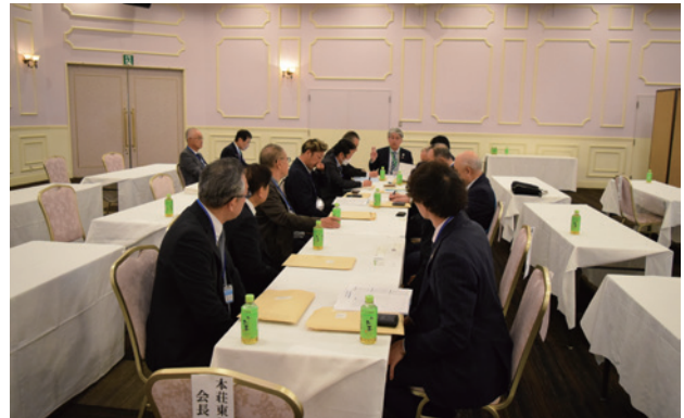
グループセッション

会長エレクト・ラーニングセミナーは4月18日、大館市のプラザ杉の子で行われました。約100人が参加し、次年度の地区方針について説明を受けた後、会員拡大など重要課題を共有し、その方策について話し合いました。