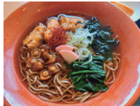
例会メシはお蕎麦