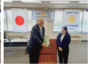
帰省していたフォンさんから土産