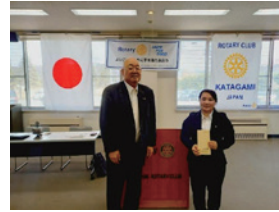
フォンさんに奨学金の贈呈