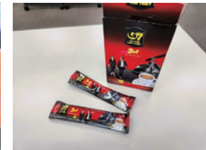
お土産はインスタントコーヒー ベトナムで有名だそうです